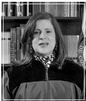
Magistrada Ponente Rocío Araújo Oñate